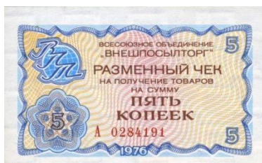
20103 - 1976 5 Kopeke

Nadat de Vneshposyltorg certificaten waren geannuleerd werden in 1976 de VPT cheques geïntroduceerd. Deze zijn in omloop gebleven tot 1992. De VPT cheques van 100,250 en 500 roebels hebben op de rugzijde een witte ronde ruimte met de tekst "gereserveerd voor stempel" (Mesto dlya Pechati).