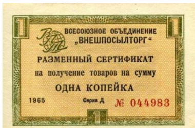
10101 - 1965 - 1 Kopeke

Ook voor interne producten zoals de auto's van Volga of Lada werden gespecialiseerde winkels opgezet. Een andere soort winkel waren de Smile shops. Hier konden geregistreerde werkers zich inschrijven voor luxe appartementen (meer dan 5 vierkante meter per familielid) en garages, indien men reeds over een auto beschikte. In 1992 werden de certificaten en cheques geannuleerd en accepteerden de Beriozkas ook harde externe valuta.