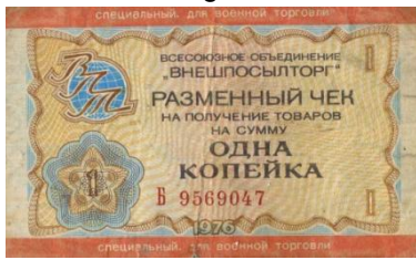
30101 – 1976 1 Kopeke

Eind december 1979 trokken de Sovjet troepen Afghanistan binnen. Begin 1980 reeds kregen de troepen VPT cheques (M-VPT). Door het grootschalige gebruik hiervan werd midden jaren tachtig besloten een eigen variant voor de militairen in omloop te brengen.