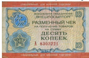
30104 - 1976 10 Kopeke