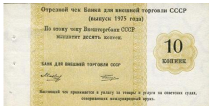
61004 – 1975 10 Kopeke

Sovjet burgers mochten niet meer dan 30 roebles tegelijk opnemen bij hun bank. Dit was echter onvoldoende voor de toeristische trips. Daarom konden Cruiseschip cheques worden gekocht waarmee kon worden betaald aan boord van de schepen en in beperktere mate ook op treinen en vliegzeizen.