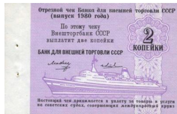
61302 – 1980 2 Kopeke