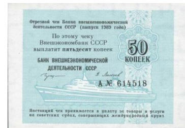
61503 – 1989 50 Kopeke

Omdat in de loop der tijd het gebruik van deze cheques steeds uitgebreider werd bestaan er ook van deze cheques diverse varianten. De eerste cheques werden in omloop gebracht zonder vervoersmiddelen er op later kwamen er cheques met een vliegtuig, een trein, een boot en combinaties hiervan.