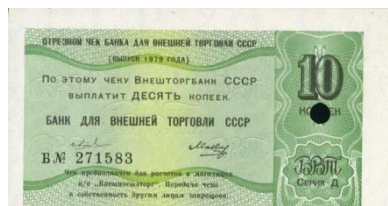
50804 – 1979 10 Kopeke