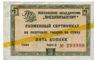
10203 - 1965 5 Kopeke YB