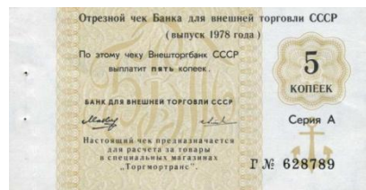
41601 – 1978 5 Kopeke