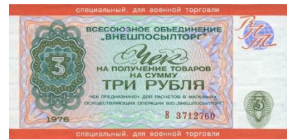
30108 - 1976 3 Roebel

De M-VPT cheques onderscheiden zich door een rode streep aan de onderkant en de bovenkant van de cheques. Deze M-VPT cheques werden niet geaccepteerd in de Beriozka winkels maar moesten bij terugkeer naar de USSR worden ingewisseld tegen normale roebels.