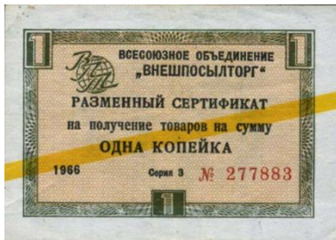
10215 1966 1 Kopeke YB

De koopkracht van de witte, blauwe en gele certificaten was verschillend. Sommige goederen waren alleen te koop met certificaten zonder streep. Op andere goederen moest worden bijbetaald indien met certificaten met blauwe streep werd betaald.