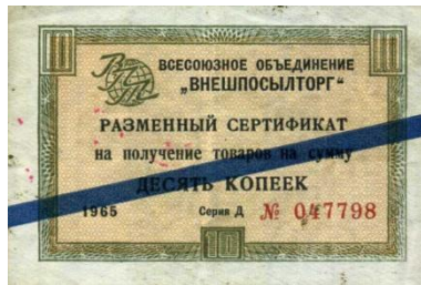
10304 1965 10 Kopeke BB