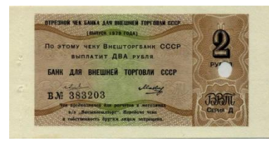
50808 – 1979 2 Roebel

In eerste instantie werden de cheques in omloop gebracht zonder een serienummer. In een later stadium werden de cheques random van een nummer voorzien. Van een aantal verschillende jaren zijn cheques met en zonder nummer bekend.