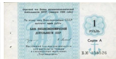
41804 – 1989 1 Roebel

Er bestaan twee verschillende soorten van S-VPT: