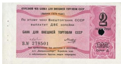
50802 – 1979 2 Kopeke

Vanaf het midden van de jaren zestig kregen bepaald groepen diplomaten cheques toegewezen. Helaas is niet gedocumenteerd wie deze kreeg en in welke denominaties. Deze D-VPT cheques hebben als serieletter de letter D. Om te voorkomen dat de diplomaten in contact zouden moeten komen met specialisten uit allerlei ontwikkelingslanden werden er drie speciale Beriozka winkels geopend waar alleen met de VPT-D cheques kon worden betaald.