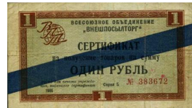
10321 - 1966 1 Roebel BB

De kleinere nominaties werden exchange certificaten genoemd en de nominaties van meer dan 1 roebel noemde men certificaten. Alle certificaten hebben een watermerk. Hoewel een aantal van de in omloop zijnde certificaten zijn afgestempeld was er van een officieel stempelsysteem geen sprake.