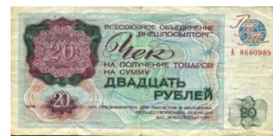
20111 - 1976 20 Roebel

Bij betalingen met hogere denominaties (100, 250 en 500 roebels) werd door de kassier tweemaal een driehoekje uitgeknipt waardoor de cheques ongeldig werden. Omdat ze daarna meestal werden vernietigd zijn deze biljetten dus voor verzamelaars bijna onvindbaar.