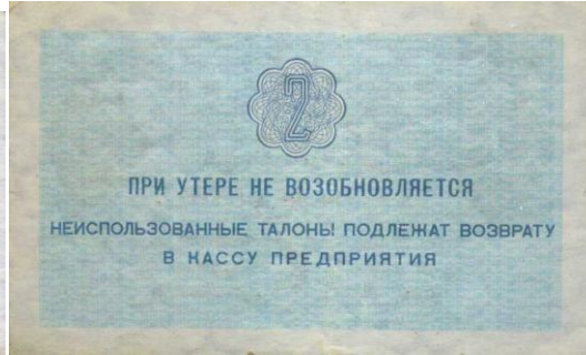
9.79.02 2 Kopeke 1979