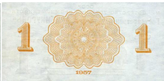
9.57.01 1 Kopeke 1957