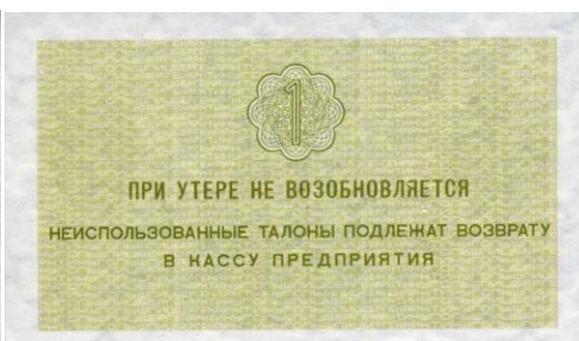
9.79.01 1 Kopeke 1979