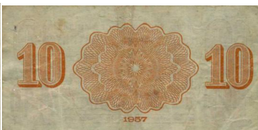
9.57.04 10 Kopeke 1957