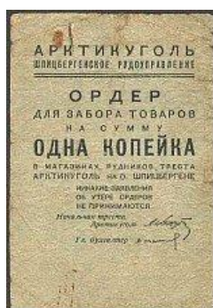
9.31.01 1 Kopeke 1931