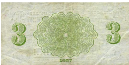
9.57.02 3 Kopeke 1957