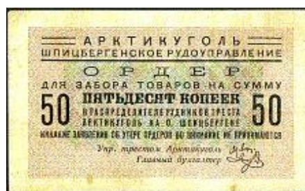
9.35.07 50 Kopeke 1935

In 1933 werden meteorologische en radiografische begonnen in Barentsburg. Het grootste deel van deze diensten werden in 1952 verkocht aan S.N.S.K. Op alle bankbiljetten van Artikugol, behalve die verschenen zijn in 1931 en 1979, staat het jaar van verschijning. In