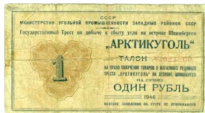
9.46.08 1 Ruble 1946

Door de oorlog werden de werkzaamheden stilgelegd tot 1946 / 1947 toen men Spitsbergen de hoofdvestiging van het bedrijf maakten. Vrij snel echter werd weer teruggekeerd naar Barentsburg. Op alle Artikugol bankbiljetten staat de tekst: "The Ministry for Coal Industry in the Western Areas of the Soviet Union. The State Enterprise for the Mining and Sale of Coal on the Island of Spitsbergen. ARCTICUGOL Token no. xxxxx grants the right to draw supplies from the mining company Arcticugol's stores on the Island of Spitsbergen to the amount of xxx kopeks/rubels. No loss declaration will be accepted."