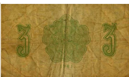
9.61.03 3 Kopeke 1961