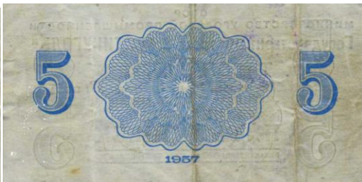
9.57.03 5 Kopeke 1957