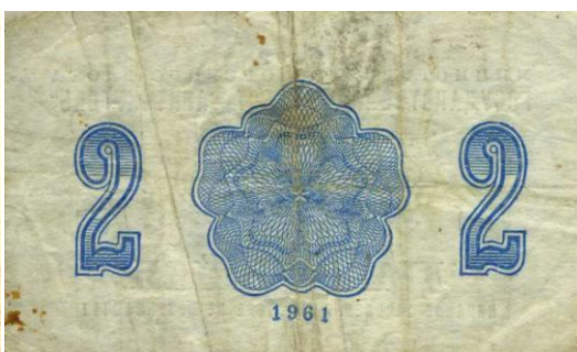
9.61.02 2 Kopeke 1961