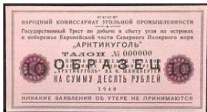
9.40.11 10 Ruble 1940