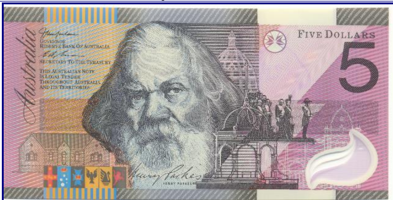
Australië 5 dollar polymeer

hier afgebeelde biljetten, bij Enschedé zijn gedrukt heb ik dan ook uit hun reclamedrukwerk.