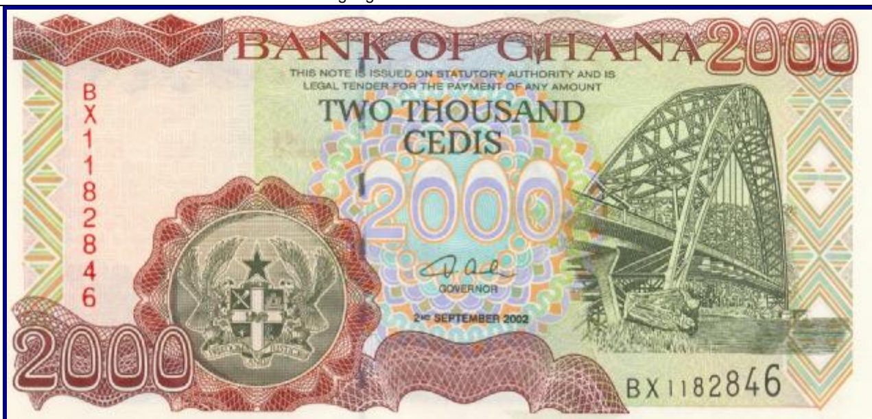
Ghana 2000 Cedis

Mondjesmaat is er wel eens wat te vinden, soms in het reclamedrukwerk, dat helaas, ook heel moeilijk verkrijgbaar is voor buitenstaanders.