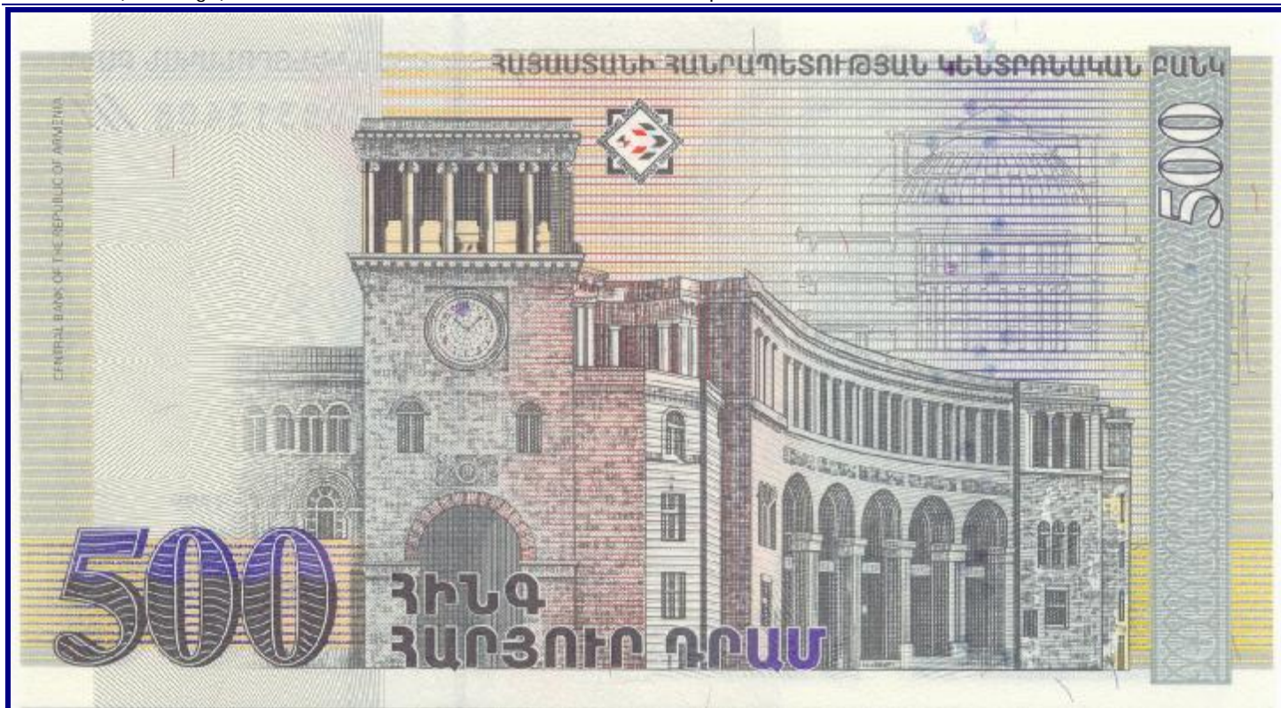
Achterkant van een biljet van 500 Dram Armenië 1999. (Ook het biljet van 5.000 Dram is hier gedrukt.)

Producten van Johan Enschedé zijn veel moeilijker te herkennen. Behalve de biljetten van de landen die destijds onderdeel waren van ons Koninkrijk, daarop staat wel steeds de naam Enschedé. Op de recentere biljetten van Suriname nu ook nog.