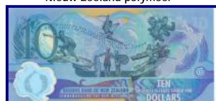
Biljet van 10 dollar "millennium note" Nieuw Zeeland polymeer

Ook wereldwijd is ons bedrijf actief en worden er bankbiljetten gedrukt voor landen in Zuid Amerika, Afrika en Zuid Oost Azië."