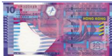
10$ Hong Kong

elkaar verwant ontwerp. ( Erg saai in vergelijking met deze 10 $)